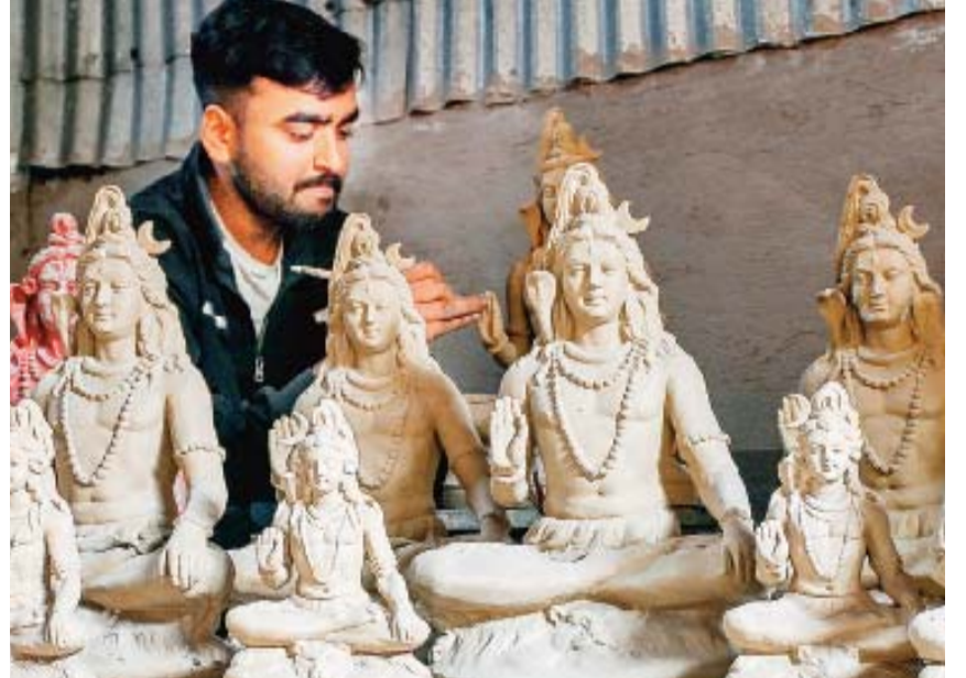
नाडिया। शिवरात्रि पर जगह-जगह स्थापित होने वाली भगवान शिव की मूर्तियों को अंतिम रूप प्रदान करता कलाकार।